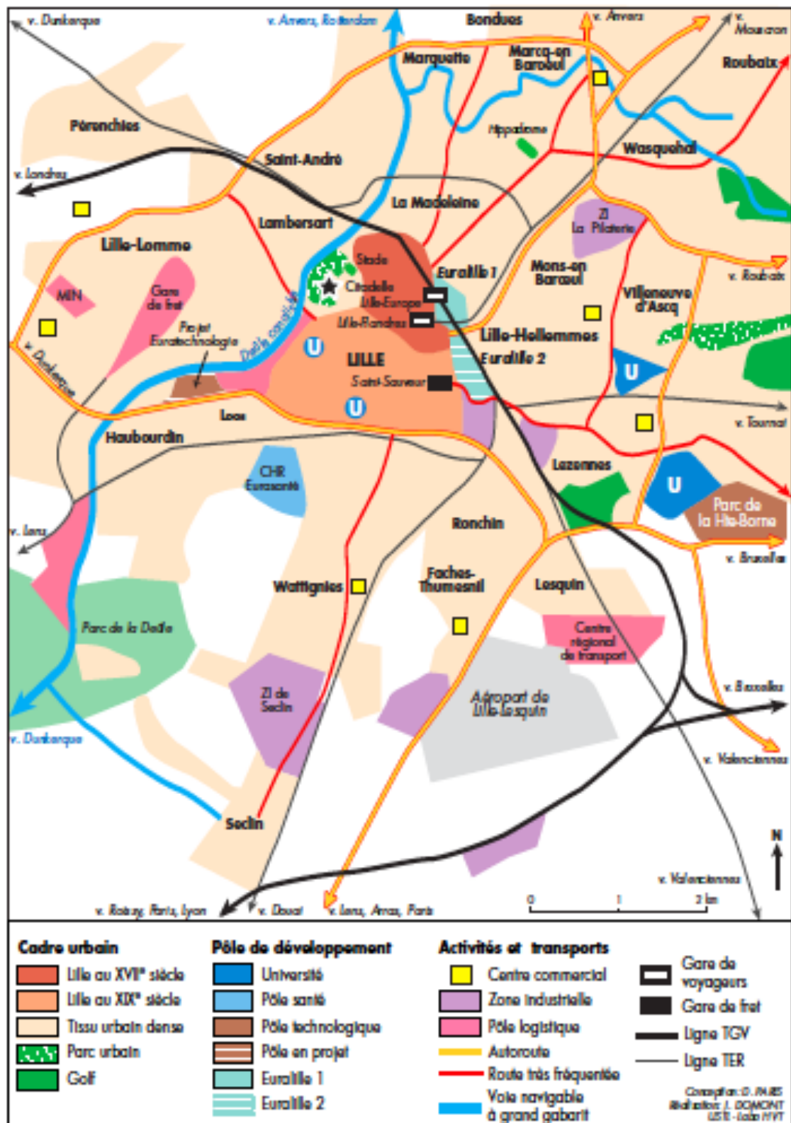
Doc. 3 :