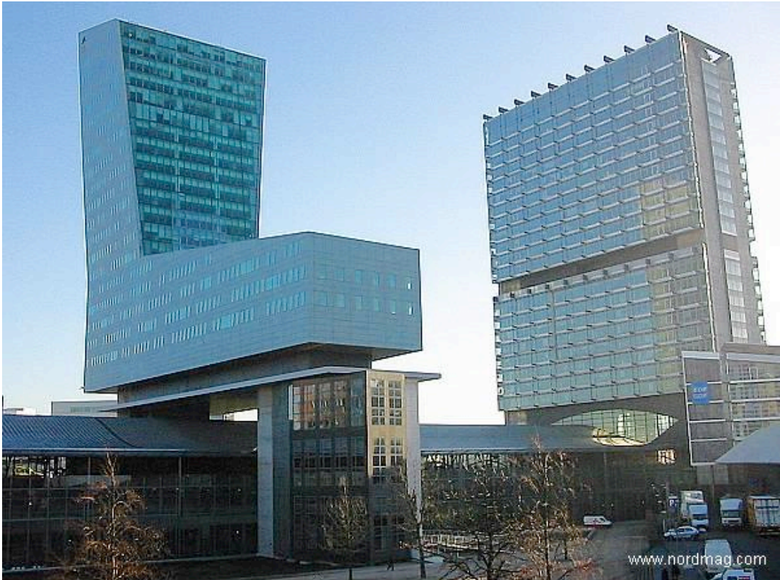
Doc. 8 : Euralille